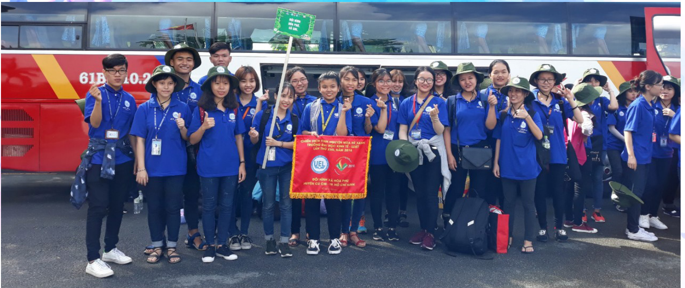
Đội hình Hòa Phú - Củ Chi

Tham gia Mùa hè xanh năm nay là quyết định đúng đắn nhất của tôi trong mùa hè năm nay. Mùa mưa đã đến, nhưng mưa không thể nào ngăn cản được tinh thần hăng hái và cuồng nhiệt của chúng tôi đối với nơi đây. Chỉ còn 3 tuần để được khoác trên người chiếc áo Mùa hè xanh nhưng còn rất nhiều việc mà chúng tôi chưa làm được. Thế nhưng, chúng tôi sẽ cố gắng hết sức để hoàn thành tốt nhất những việc mà mình có thể làm được trong khoảng thời gian ít ỏi còn lại vì một mùa hè xanh ngọt ngào khắp nơi đây.