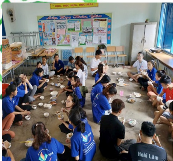
Đội hình Măng Tố - Tánh Linh

Một tuần trôi qua, thông qua những hoạt động của đội hình các bạn chiến sĩ trong đội hình đã dần làm quen với công việc và thân thiết hơn với những người bạn mới tại nơi đóng quân.